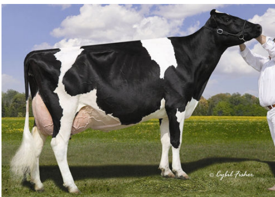
LYLEHAVEN LILA Z FIFTH DAM