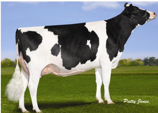
MAPEL WOOD M O M LUCY THIRD DAM